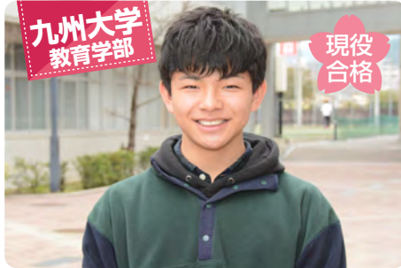
九州大学 教育学部

先生方の自身の濃い授業や、部活動や行事などに全力を尽くすことができる素晴らしい環境が筑陽学園には揃っています。私は、中高6年間吹奏楽部に所属し、様々な学年の人達と関わったことも、受験勉強の中で大きな支えとなりました。この学園だったからこそ全てにおいて最後までやり遂げ、合格を手に入れることができました。