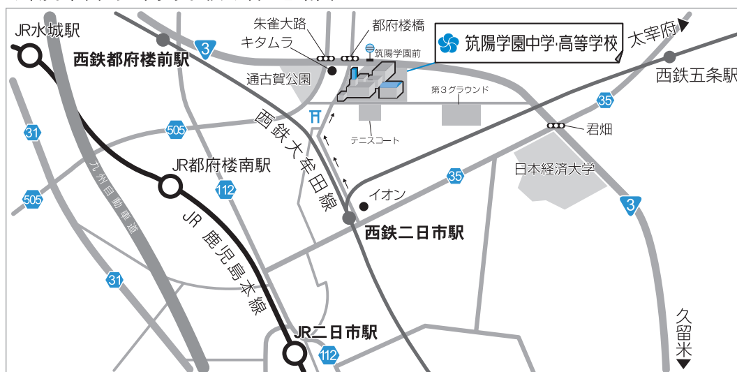
筑陽学園中学・高等学校 所在地略図